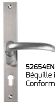
52654EN179IN Béquille intérieure Conforme EN179