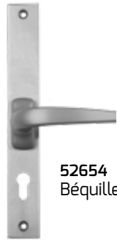
52654 Béquille intérieure