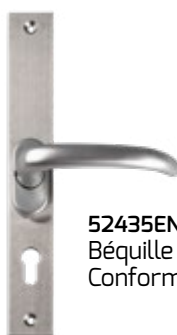
52435EN179IN Béquille intérieure Conforme EN179