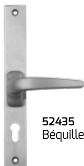
52435 Béquille intérieure