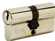
RON.30x30 Cylindre Ronis 30x30