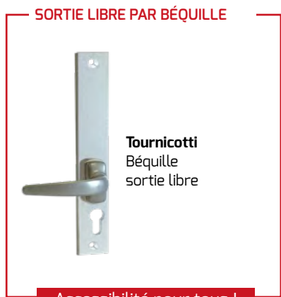
Tournicotti Béquille sortie libre