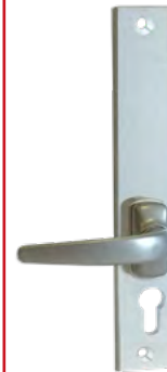
Tournicotti Béquille sortie libre