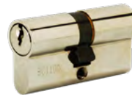
RON.30x30 Cylindre Ronis 30x30