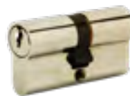
RON.30x30 Cylindre Ronis 30x30