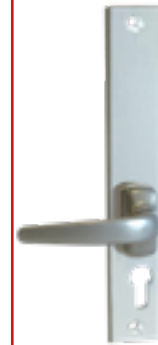
Tournicotti Béquille sortie libre Uniquement pour les modèles 2022 et +